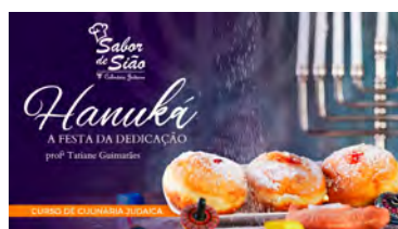
SABOR DE SIÃO - HANUKÁ (A Festa das Luzes) Culinária judaica