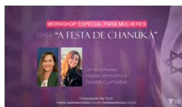
“A FESTA DE CHANUKÁ” WORKSHOP ESPECIAL PARA MULHERES