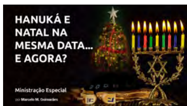
Hanuká e Natal na mesma data... e agora?