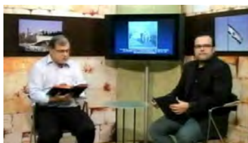
Torá em Debate A Festa de Hanuká