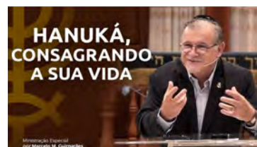
Hanuká, Consagrando a Sua Vida